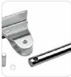
Ataque vástago en acero