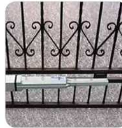
Ejemplos de instalación